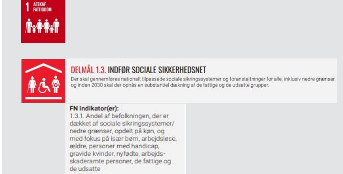
Figur 2.2 Illustration af verdensmålenes opbygning: Mål, delmål, hensigtserklæring og indikator