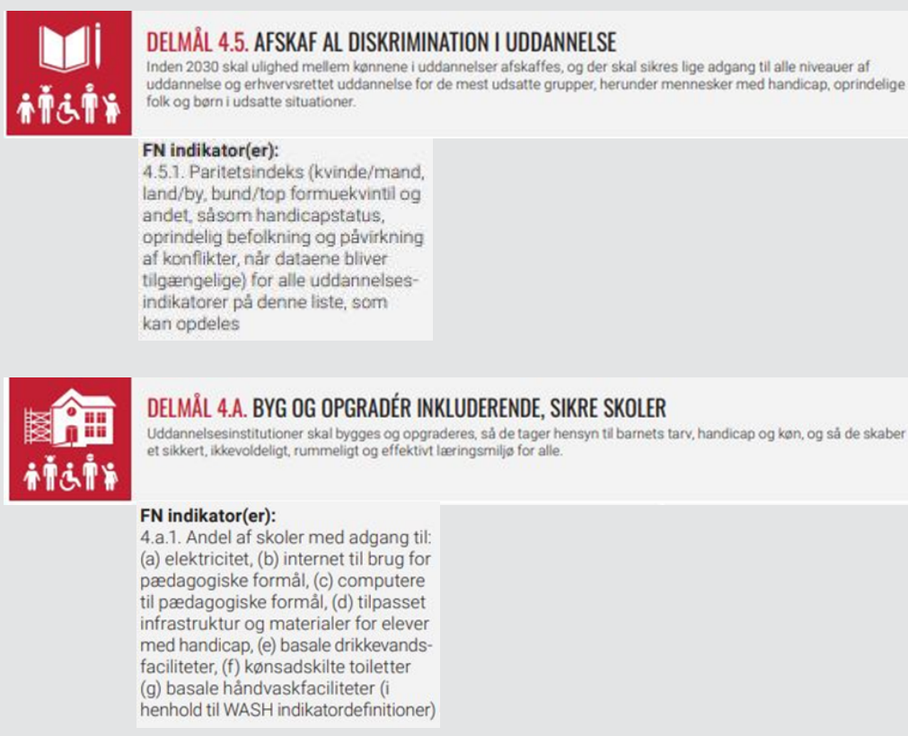
Figur 3.1 FN-del mål: Funktionsnedsættelse/handicap og uddannelse